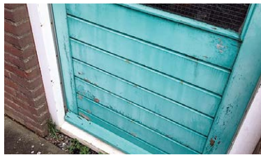
Vervuild en lichte houtaantasting