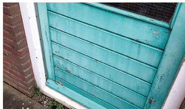
Vervuild en lichte houtaantasting